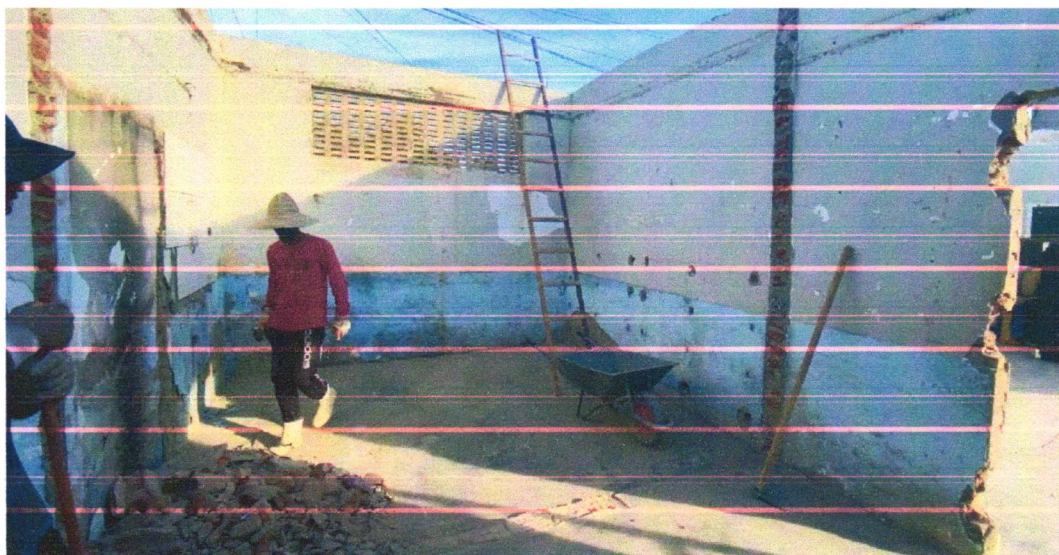
Demolição de Alvenaria