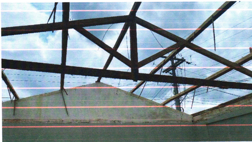
Retirada da estrutura de Telhado