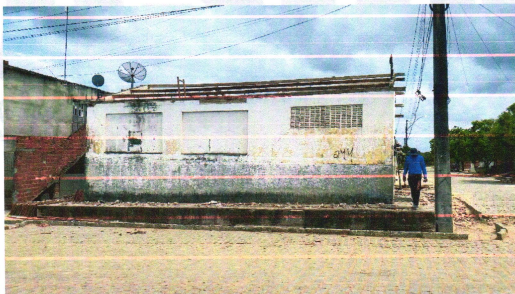
Retirada da estrutura de telhado

RIACHÃO DO JACUIPE-BAHIA, 16 DE OUTUBRO DE 2023