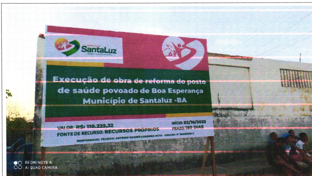
Placa da Obra