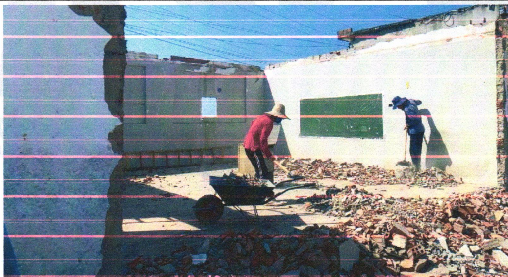
Demolição de Alvenaria

RIACHÃO DO JACUIPE-BAHIA, 16 DE OUTUBRO DE 2023